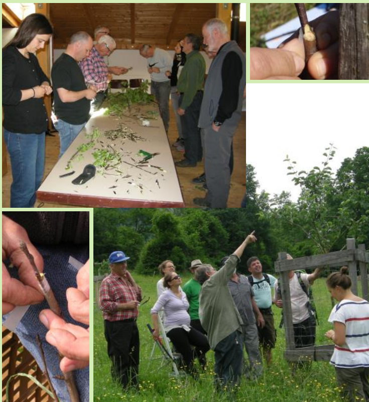
Abb. oben li.: Mit ein bisschen Übung kann jeder die Technik des Veredelns oder „Zweiens“ lernen.

Zum Thema Düngung lernten die Teilnehmer, wie wichtig es ist, die Obstbäume mit den richtigen Nährstoffen zu versorgen.