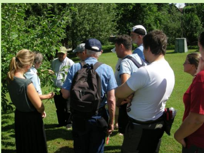
Abb.: die Inhalte des Kurses werden draussen in der Praxis anschaulich erklärt.

In der Kursreihe „Rund um den Obstbaum“ findet dieses Jahr noch der Sommerschnittkurs statt, und zwar zusammen mit dem Thema Pflanzenschutz am Samstag, 15. Juni . Anmeldungen bitte bei der Geschäftsstelle.