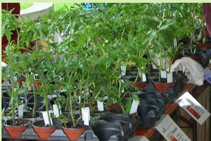
Abb.: in Liechtenstein gefundene alte Tomatensorten werden in der agra in Mauren vermehrt und als Setzlinge verkauft.

Die agra des HPZ (Heilpädagogisches Zentrum) in Mauren produziert Jungpflanzen von verschiedenen HORTUS-Tomatensorten. Diese werden im Hofladen in Mauren und an diversen Wochenmärkten im ganzen Land verkauft.