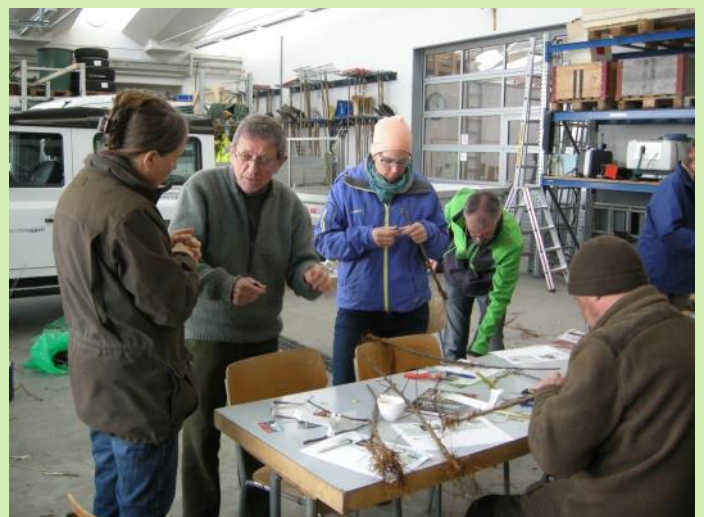
Abb. oben: Bäume werden in der Regel in der Winterruhe geschnitten. Unten: das Veredeln ist einfach zu erlernen.

Vielen Dank an dieser Stelle dem Forstwerkhof Triesen und dem Werkhof Ruggell , dass wir ihre Räumlichkeiten nutzen durften!