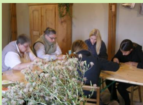
Abb. li.: die Teilnehmer*innen üben praktisch, Salatsaatgut zu ernten, Bohnen zu sortieren und Tomatensamen zu gewinnen.

Zum dritten Mal hat am 22. September 2018 der Saatgutvermehrungskurs in der Mühle Eschen stattgefunden. Vielen Dank dem Rebelbollaclub Eschen , der uns die Möglichkeit gab, den Kurs dort abzuhalten. Die Teilnehmer*innen waren wieder mit grossem Interesse dabei und lernten, was es braucht, um Saatgut selbst zu gewinnen.