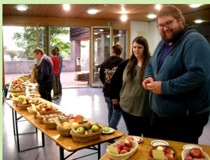
Abb. oben: Fernsehbeitrag über die Sortendegustation im Kanal 1FL.LI Abb. unten: reges Interesse an den ausgestellten Sorten.